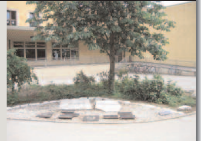
So präsentiert sich unser Denk-Mal inzwischen dem Betrachter.

Die Begriffe „Täter“ und „Opfer“ kristallisierten sich rasch heraus und wurden später durch die Aussage „Mensch ist Mensch“ und „Befehl ist Befehl“ verdeutlicht. Es folgten intensive, ernsthafte, arbeitsreiche Stunden der Auseinandersetzung mit dem Thema und dem Künstler über das endgültige Aussehen des Denkmals.