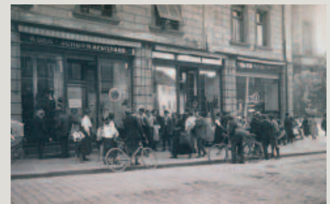
Großes Gedränge vor dem Schuhwarenhaus Kohn in der Klostersteige