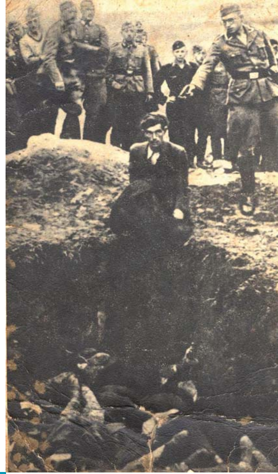
فبينتزا، في أوكرانيا، جنود ألمان يشاهدون جندياً من «فرق القتل الخاصة» وهو يقتل يهودياً، في تموز/ يوليو ١٩٤١

في ألمانيا فقط، وإنما في معظم البلدان الأوروبية، إلى التوعية بشأن أدوار ومسؤوليات الدولة والأفراد والمجتمع ككل في مواجهة تزايد انتهاكات حقوق الإنسان. ومن الأمثلة الأخرى الجديرة بالدرس في هذا الصدد تصرفات الأطباء والمرضات الألمان في إطار تطبيق برنامج القتل الرحيم المسمى بـ«العملية T4» في ألمانيا النازية (التي أدت إلى قتل أكثر من ٢٠٠ ٠٠٠ شخص من المعوقين عقلياً أو جسدياً من الرجال والنساء والأطفال على مدى ست سنوات). وبالمثل، فإن مشاركة الجنود الألمان العاديين في قتل أكثر من مليون يهودي كجزء من عمل «فرق القتل الخاصة» في الأجزاء الشرقية من أوروبا، تدفع إلى التساؤل بشأن سلوك الإنسان، ونزعة الانسياق، وقوة الإيديولوجيات، وباختصار بشأن مسوغات تأييد المجتمع لحكومات تقوم بأفعال تنتهك حقوق الإنسان المعترف بها دولياً. إن بإمكان التعليم بشأن الهولوكوست أن يساعد الشباب على فهم أفكار هامة كقيلة بأن تفيدهم في دراسة أمثلة أخرى عن ممارسات العنف الجماعي. وحين يستكشف الطلاب تاريخ حالات أخرى لانتهاكات جماعية لحقوق الإنسان، سيمكنهم الاعتماد في ذلك على فهمهم لأحداث الهولوكوست، وسيصبحون أكثر وعياً بمسؤولياتهم كمواطنين عالميين.