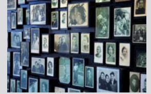
معرض صور شخصية عائلية، في متحف الدولة في أوشفيتز، ببيركنو

السياسات التدميرية التي اتبعتها ألمانيا النازية والمتعاونون معها. وينبغي، عند دراسة الحالات الأخرى لأعمال الإبادة الجماعية، أن يولي الاهتمام للسياسات الخاصة بكل حالة من هذه الحالات. وتشكل المقارنة البنيوية بين عمليات الإبادة الجماعية هذه أساس الدراسات المقارنة لحالات الإبادة الجماعية. غير أنه لا يمكن لأي أحد أن يفترض أن معاناة ضحايا الهولوكوست كانت أكبر من معاناة أولئك الذين قُتلوا في عمليات أخرى للإبادة الجماعية. فينبغي أن يتم فهم كل مثال من أمثلة أعمال العنف الجماعي، بما فيها حالة الهولوكوست، فهماً محدداً خاصاً بالحالة المعنية، بدون التقليل من شأنها، أو الاستهانة بها، أو نكرانها.