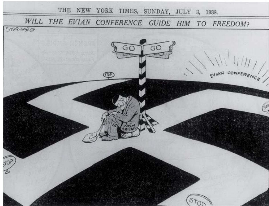
A British cartoon reflecting the hopes that are placed in the Evian Conference—This meeting, to be at Evian, France, on Wednesday out of thirty-three nations asked to join, refused to participate. Myron C. Taylor, industrialist, will represent the United States.

في مجرى التاريخ، وإنما هي أحداث يمكن درؤها. وعند التمعن في أحداث الهولوكوست، يدرك المرء إدراكاً قوياً مدى التعقيد الذي تنطوي عليه وأنها لا يمكن أن تفسر ببساطة، وإنما هي نتيجة عوامل تاريخية واقتصادية ودينية وسياسية عديدة؛ ويسهم هذا الإدراك بدوره في فهم أن درء عمليات الإبادة والفظائع الجماعية يمكن أن يبدأ عند تشخيص المؤشرات التي تنذر بوقوع مثل هذه الأعمال.