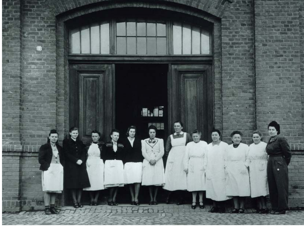
فريق الممرضات العاملات في مركز هادامار للقتل الرحيم، في ألمانيا