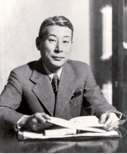
أصدر تشيون سيمبو، القنصل العام لليابان في كوفينو، أكثر من ٢٠٠٠ تأشيرة سفر ساعد بها اللاجئيين اليهود على الهرب من أوروبا

إن عدم القيام بأي شيء عندما يكون هناك آخرون يتعرضون لقمع وحشي ناجم عن تدابير حكومية، هو شكل من أشكال التواطؤ جعل سلوك المتعاونين، في حالة أحداث الهولوكوست، سلوكاً مقبولاً اجتماعياً بقدر أكبر