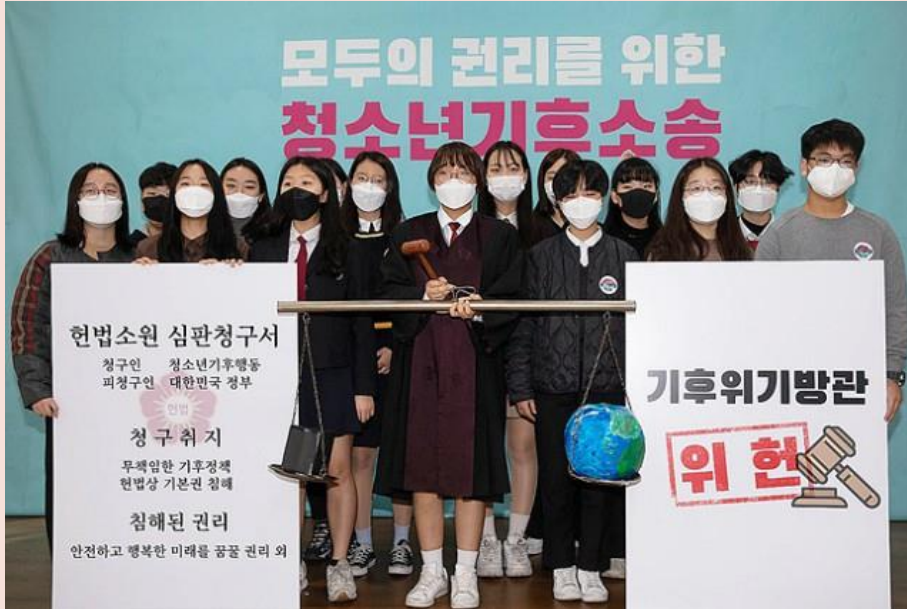
Constitutional Petition by 'Youth Climate Crisis Action' (Mar. 13 th , 2020)

16 metropolitan & provincial superintendents declared to strengthen environmental education on climate crisis (July 09 th , 2020)