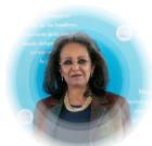
S.E. Mme Sahle-Work Zewde Présidente de la Commission internationale