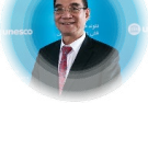
Justin Yifu Lin