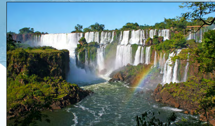
A caballo entre Brasil y Argentina, las impresionantes cataratas del río Iguazú se extienden a lo largo de casi 3 km con cascadas verticales de hasta 80 metros. Este impresionante paisaje, que se encuentra en el marco de un ecorregión biotípica subtropical de hoja ancha, es la principal atracción del Parque nacional Iguazú, en Brasil, que alberga numerosas especies de flora y fauna.