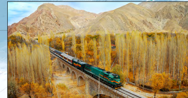
La construcción de los 1.394 km del Ferrocarril transíero, inaugurado en 1938, ha supuesto 11 años de enormes dificultades. Consta de 224 túneles, 174 viaductos y 159 puentes menores. Conecta el mar Caribe en el noreste, con el golfo Périco en el suroeste, atravesando dos cadenas montañosas, así como ríos, desiertos hostiles, terrenos áridos, densos bosques y llanuras, y cuatro zonas climáticas diferentes.