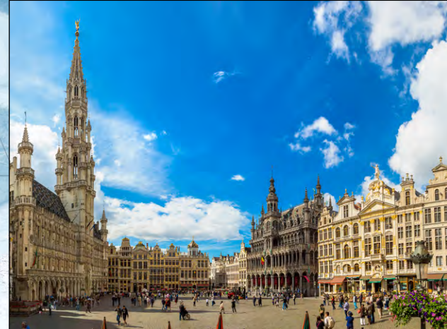
La Grand Place es un conjunto armonioso de edificios públicos y privados que ilustran el dinamismo cultural y social de la capital brujelense desde finales del siglo XVIII. Entre los numerosos edificios de la plaza, adornados con fachadas doradas, y el esplendoroso campanario del ayuntamiento, destacan en esta importante centro político y comercial una acrotis mecia de estilos que van del gótico al barroco.