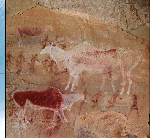
La zona montañosa de Makot-Draakensberg, que se extiende de Sudáfrica a Lesoto, alberga miles de notables pinturas rupestres que representan la vida espiritual del pueblo San durante un periodo de 4.000 años. Estas antiguas pinturas suelen representar a cazadores y animales, especialmente elefantes, una especie de antílope sudocentrio.