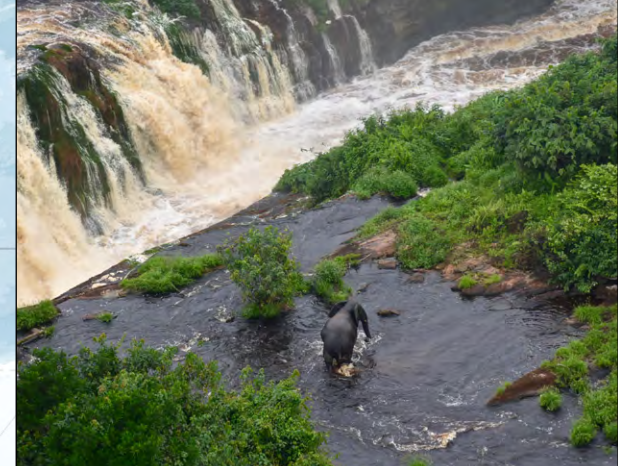
Los elefantes de la selva africana han sido clasificadamente recientemente en peligro crítico de extinción debido a que los conflictos, la caza furtiva y la deforestación han reducido su número. Ahora, sobreviven en gran parte en el Parque Nacional de Virungo, en el suroeste, atravesando dos cadenas montañosas, así como ríos, desiertos hostiles, terrenos áridos, densos bosques y llanuras, y cuatro zonas climáticas diferentes.