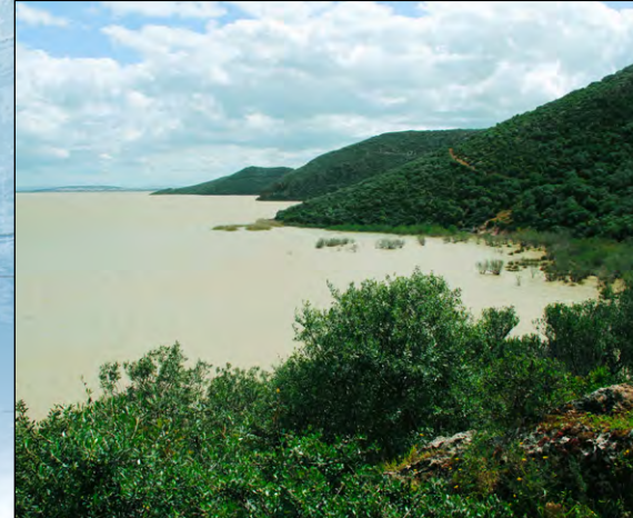
El Parque Nacional de Ichkeul está situado en el extremo norte de Túnez, y el lago Ichkeul es uno de los últimos lagos de agua dulce intactos del sur del Mediterráneo. El sistema lago-marina protege por el parque es un importante lugar de invernada y cría para cientos de miles de aves migratorias, como patos, gansos, cigüeñas y flamencos rosados.