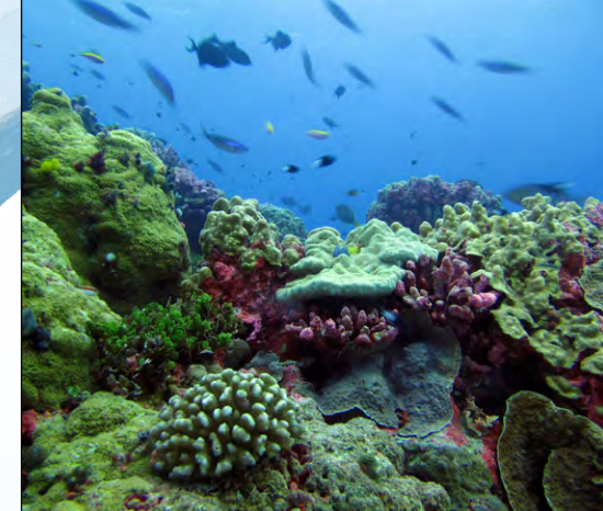
La naturaleza se impone en la Zona Protegida de las Islas Félix, situado en Kiribati, a medio camino entre Australia y Hawái, justo al sur del Ecuador. Aquí, los atolones, los arrecifes sumergidos y algunos de los montes submarinos más profundos del mundo crean un ecosistema de archipiélago coralino de vastos colores, rodeado de una abundancia de especies marinas que rara vez se encuentran en otros lugares.

De las vastas llanuras del Serengeti a los centros históricos de ciudades como Bergen, Lima o Kyoto; del arte rupestre prehistórico de la Península Ibérica a la Estatua de la Libertad; de la Casbah de Argel al Palacio Imperial de Beijing... todos estos lugares, por distintos que parezcan, tienen algo en común: todos son sitios del Patrimonio Mundial, con un valor cultural o natural excepcional para la humanidad que los hace dignos de protección para goce y disfrute de las generaciones futuras.