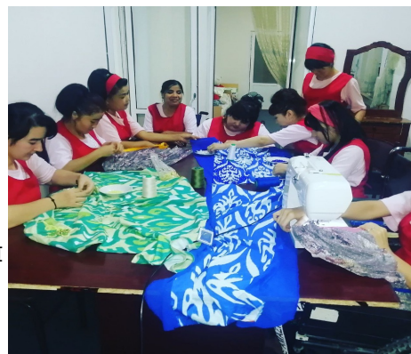
Девушки «Гулбахор Нурли Келажак» за работой.

«Мы производим более десяти швейных изделий. Шьем различные женские платья, военную форму и различную специальную форму для рабочих. Мы стали большой семьей. Живем вместе, работаем вместе и черпаем силы друг в друге. Мы ездим в разные районы нашей области. Я стараюсь радовать своих сотрудников, организуя различные мероприятия для них. Теперь есть все условия для моих сотрудников. Наши ряды пополняются день ото дня», – сказала руководительница предприятия.