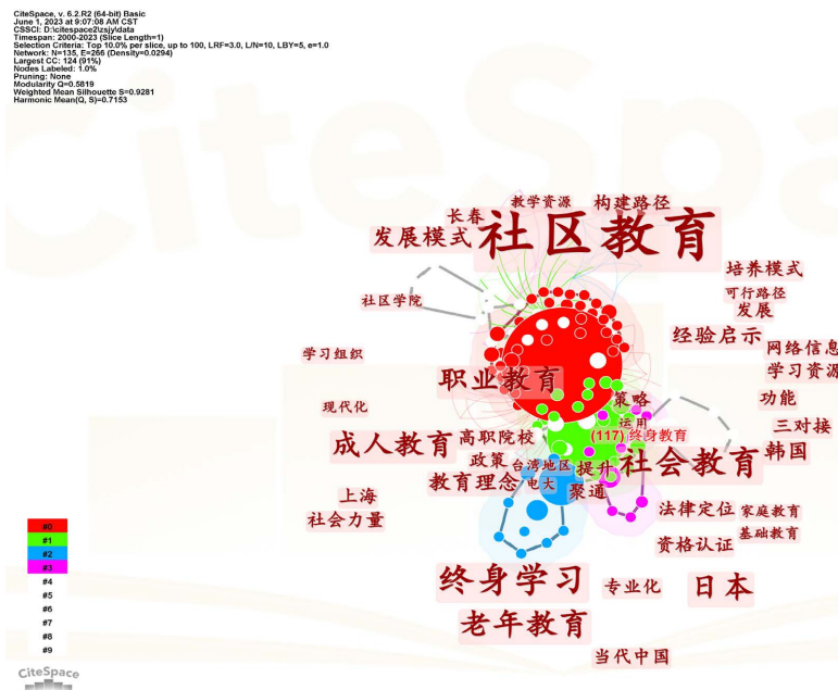
Figure 4. Keyword co-occurrence knowledge map 图 4. 关键词共现知识图谱