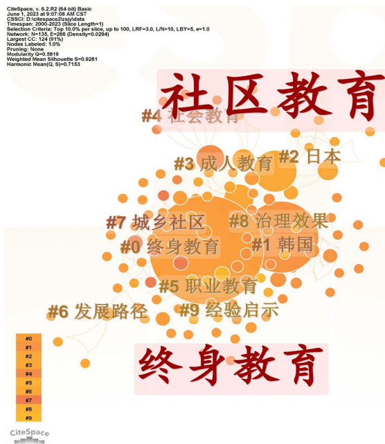
Figure 5. Keyword co-occurrence clustering analysis 图 5. 关键词共现聚类分析

为了解学者研究的重点内容，在聚类分析图谱的基础上又计算了关键词共现网络聚类表，相应值在表 3 中呈现(见表 3)。