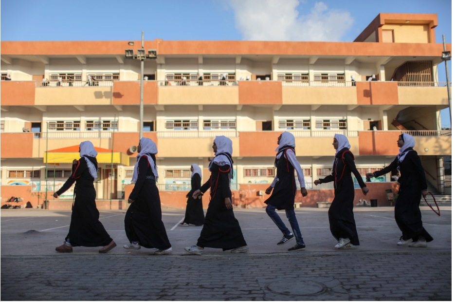
الصورة: قطاع غزة، ٢٠١٧